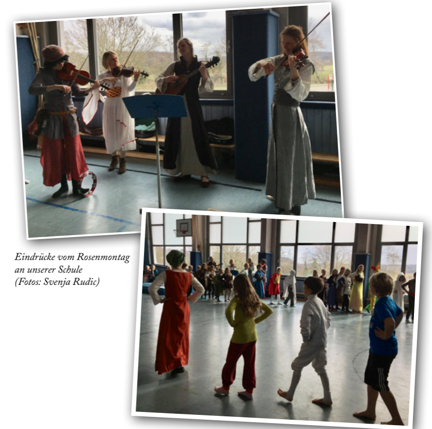
Eindrücke vom Rosenmontag an unserer Schule