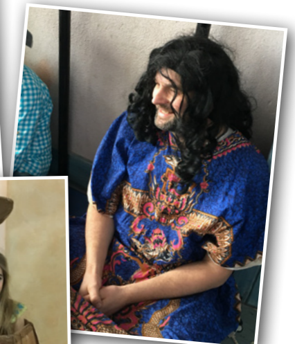
Eindrücke vom Rosenmontag an unserer Schule