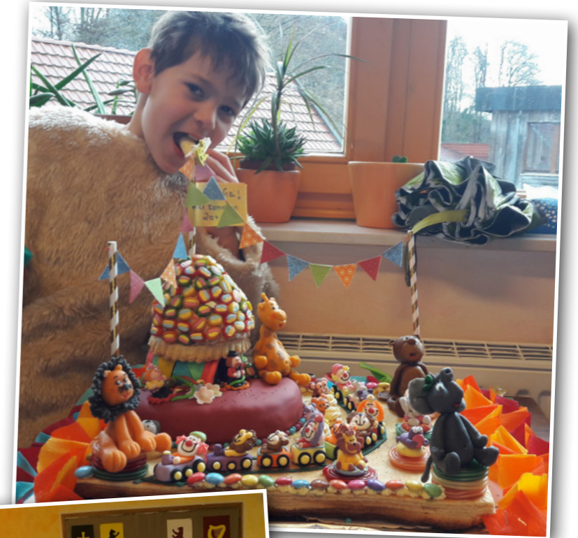
oben: Manege frei! - Karneval mit Zirkuskuchen in den 2. Klassen